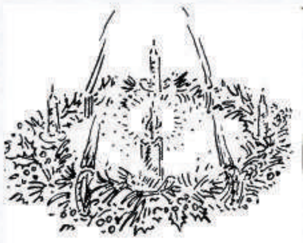
Corona de Adviento