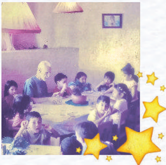
Ilustración en tinta china realizada por nuestro querido Walter