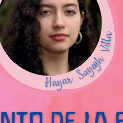
Hagar Saeghi Villa